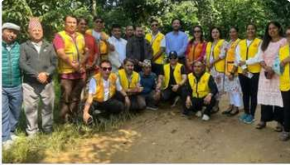
KALIKAKHABAR.COM बाढी, पाँहरा र चट्याङ पौडैतलाई राहत वितरण - Kalika Khabar