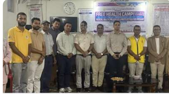
POKHARACLICK.COM लायन्स क्लब पोखरा गुडावेलद्वारा वात्स्यायन बृद्धाश्रममा निःशुल्क स्वास्थ्य शिविर तथा फलफूल